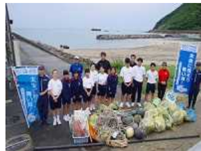
「海ごみゼロウィーク」一斉清掃

※ 環境省及び公益財団法人日本財団が、海洋ごみ対策に関する共同事業として、5月30日（ごみゼロの日）から6月5日（環境の日）を経て6月8日（世界海洋デー）前後の期間を「海ごみゼロウィーク」として定め、海洋ごみ削減に向けた全国一斉清掃活動を行い、その取組結果を世界へ発信していくもの。