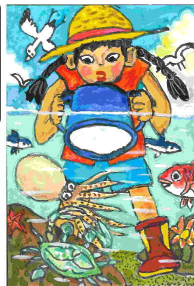
第23回 特別賞（国土交通大臣賞）受賞作品