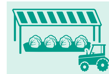
営農型太陽光（ソーラーシェアリング）