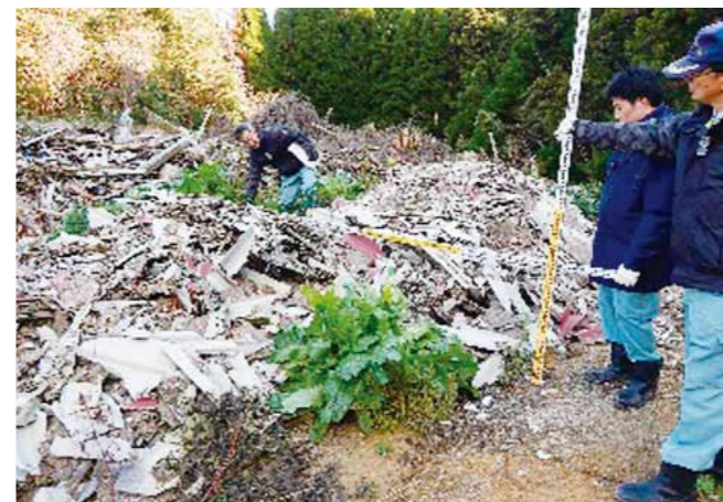
不法投棄現場のパトロール風景