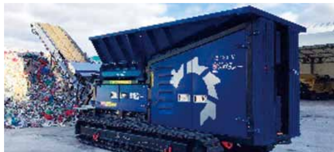
プラスチックを減容化する機器整備

[ 補助対象者：産業廃棄物処理業者等 ] [ 補助率：対象経費の1/2以内(廃プラスチック類などのリサイクル等を推進するもの及び熱回収を推進するものは2/3以内) ]