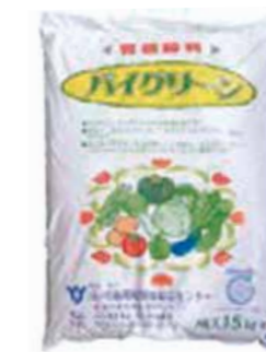
有機性汚泥を使った発酵肥料