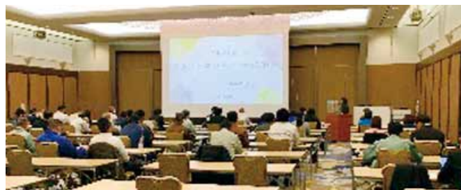
排出事業者向けセミナーの開催風景

排出事業者、産業廃棄物処理業者に対し、産業廃棄物の減量化やリサイクルに関する技術的助言や情報提供等を行います。