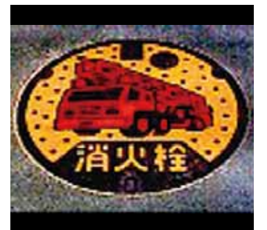
金属くずを使ったマンホールふた