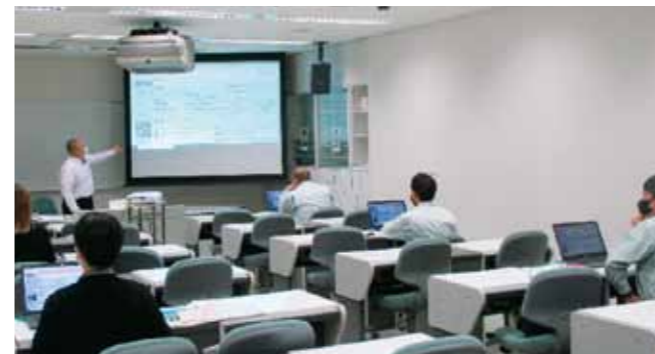
電子マニフェストの普及啓発セミナー