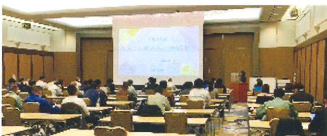
排出事業者向けセミナーの開催風景

排出事業者、産業廃棄物処理業者に対し、産業廃棄物の減量化やリサイクルに関する技術的助言や情報提供等を行います。