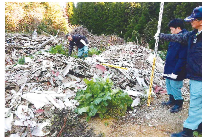
不法投棄現場のパトロール風景