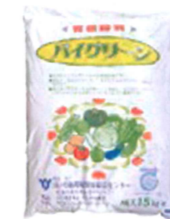
有機性汚泥を使った発酵肥料