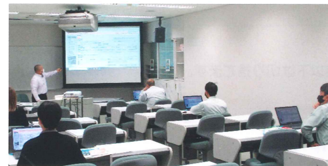
電子マニフェストの操作研修