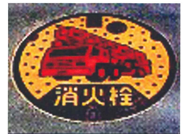
金属くずを使ったマンホールふた