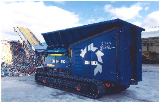
プラスチックを減容化する機器整備